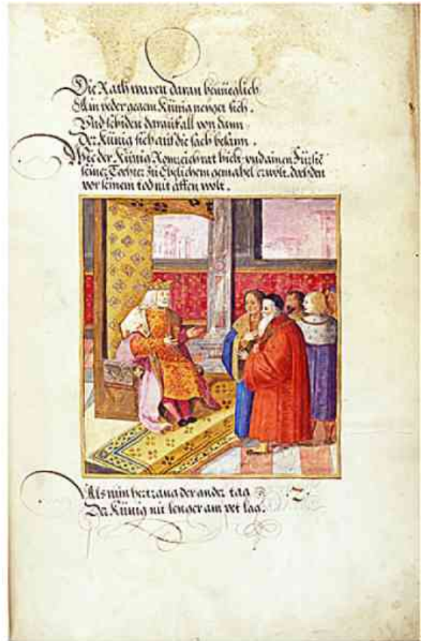
Carátulas de dos los 118 capítulos ricamente ilustrados del Theuerdank.

Cuenta la leyenda que Maximiliano había mantenido su primer «Thewerdanncks» en un ataúd y que lo llevaba en todos sus viajes como un memento mori (un recordatorio de la mortandad de los hombres). Tras su muerte su cuerpo debía ser colocado en el ataúd y extraído de éste —en memoria de sus hazañas— el poema épico para ser difundido para la posteridad.