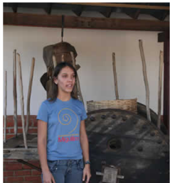
Artesanía rosiana; Interior y exterior de la Casa de la Cultura, homenajeando al Morro que da nombre al cuento y una de las Contadoras de Estórias Miguilim.

Lo destacable de esta experiencia es que un abordaje erudito de la literatura produce un diseño sumamente efectivo para la población, y que coloca al interior de Brasil como una matriz relevante para dar identidad al país. En Sao Paulo, ya dentro de la esfera urbana, esta matriz del interior seco y rural del Sertón ha motivado también obras de diseño arquitectónico como el centro cultural SESC Pompeia, uno de los más visitados por la población.