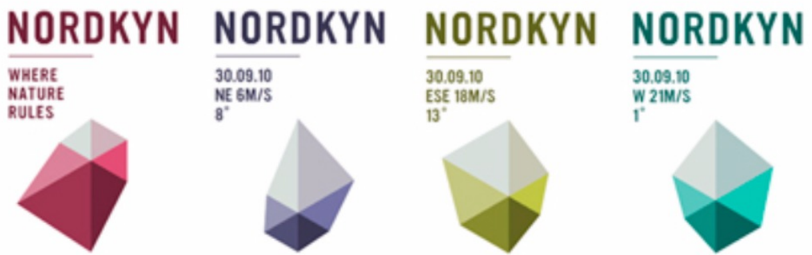
Marca mutante da Península Escandinava Nordkyn que informa a temperatura, quando o usuário passa o mouse acima do símbolo. Copyright 2012 by Dynamic Identities, p. 190-191.

Através dos anos, a empresa nascida no ciberespaço, a Google, além de homenagear eventos importantes, começou a desenvolver alterações complexas em seu logotipo para difundir informações de cunho político sociocultural de todo o mundo, por meio da composição visual, ora estática, ora animada, dos caracteres de sua marca. No entanto, a partir de 2010, a Google apresentou mais uma mutação em seu logotipo permitindo ao usuário a possibilidade de interagir com sua identidade digital.